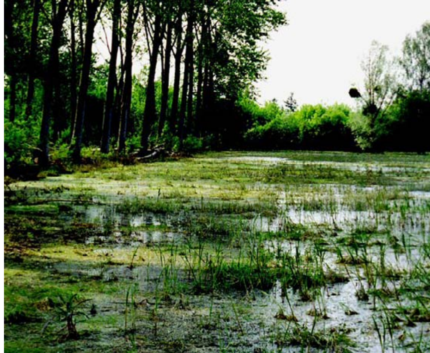
Une zone humide remarquable

La vallée plaine de la Bassée : une zone naturelle à préserver