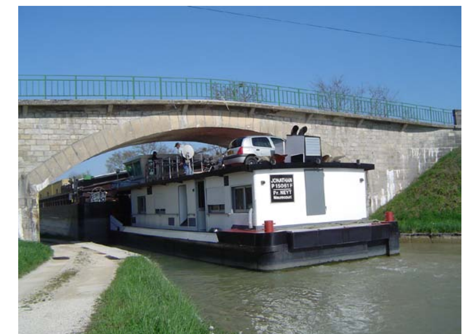
Un gabarit restreint sur le canal de Beaulieu