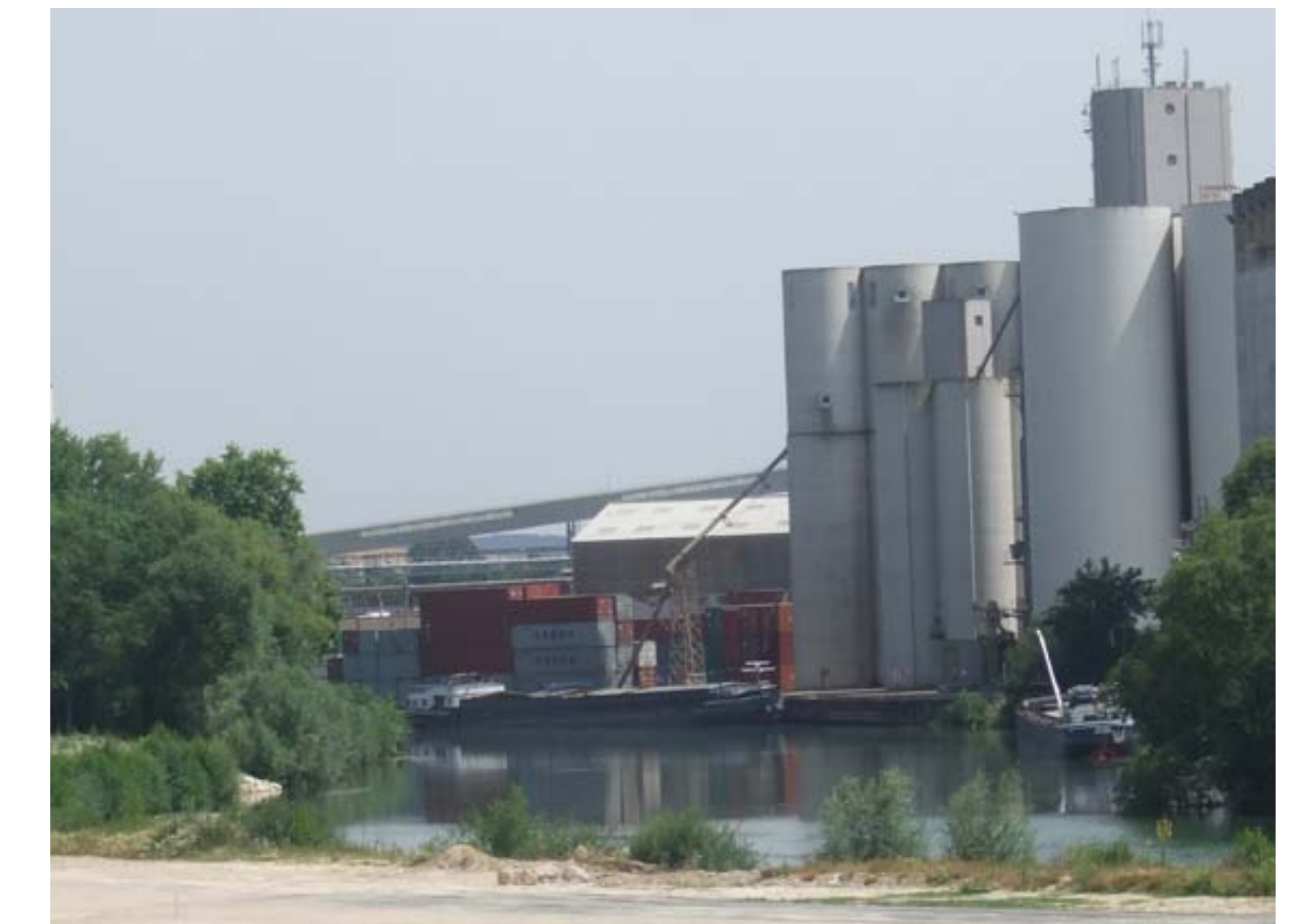
Transport de conteneurs et céréales au port de Nogent-sur-Seine

Le transport fluvial : un vecteur de développement économique local