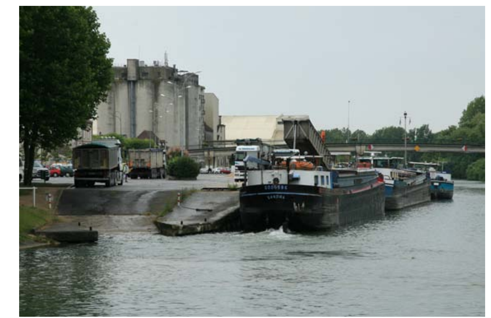
Chargement de granulats sur le port de Bray-sur-Seine