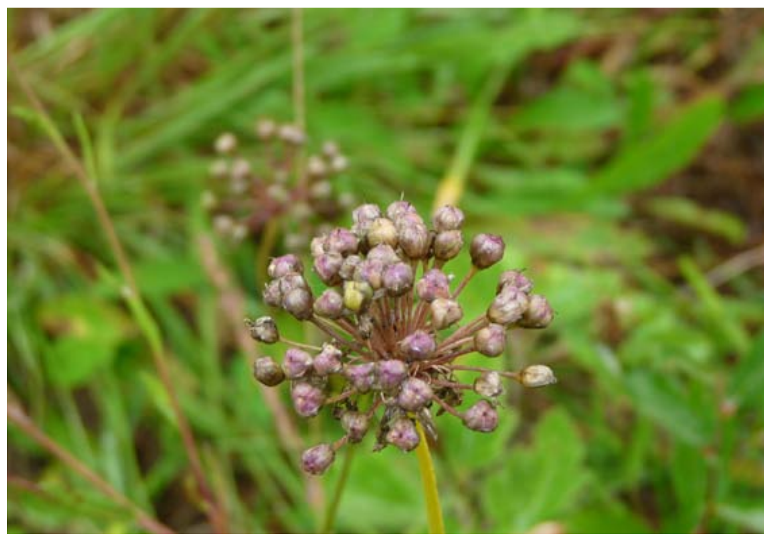
Flore : l'ail à tige anguleuse