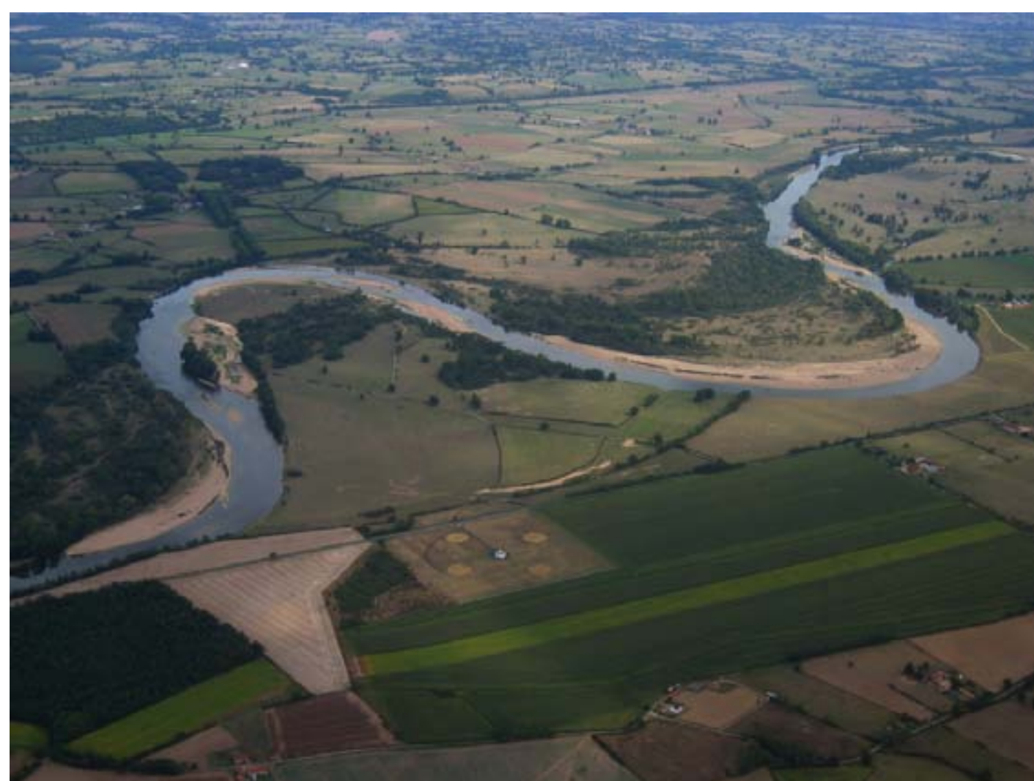
Vallée de la Bassée